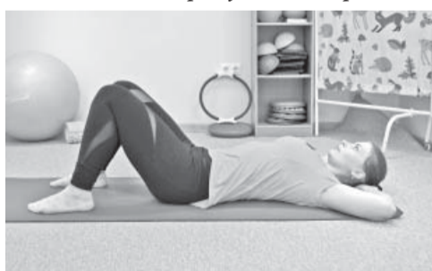
3. Sākumstāvoklis: kājas saliektas ceļos, rokas aiz galvas. Izpilde: ieelpa, izelpas laikā kājas, saliektas ceļos pievelk pie vēdera, ieelpa nolaiž. Atkārto 15 reizes.