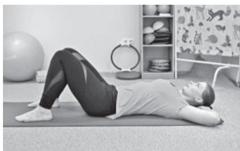
1. Sākumstāvoklis: kājas saliektas ceļos, rokas aiz galvas. Izpilde: ieelpa, izelpas laikā savieno pretējo celi ar pretējo elkoni. Tas pats ar otru roku un kāju. Atkārto 15 reizes.