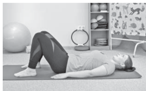
2. Sākumstāvoklis: kājas saliektas ceļos, rokas gar sāniem. Izpilde: ieelpa, izelpas laikā sasprindzina sēžas muskulatūru un balstoties uz pēdām atceļ iegumi. Ieelpā nolaiž lejā. Atkārto 15 reizes.