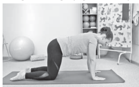
6. Sākumstāvoklis: četrpāpus

Izpilde: lēnām apsēties uz pēdām, ar rokām pastiepties uz priekšu. Atkārto 15 reizes.