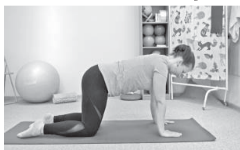
4. Sākumstāvoklis: četrpāpus

Izpilde: iztaisno pretējās puses roku un kāju. Tas pats ar otru roku un kāju. Atkārto 15 reizes.